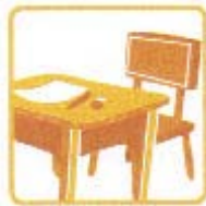
Apprentissage en Classe