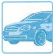
Apprentissage sur la Route